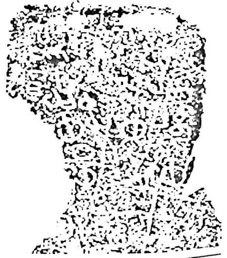
அபயகிரி வளாகத்துக் கல்வெட்டு