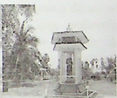
1. கத்தோடை தீமையின் மூலம் 2. கத்தோடை தீமையின் கிணம்