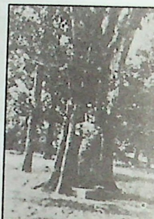
ചിത്രം 10 മുണ്ടാക്കിയതാണ്, 1991