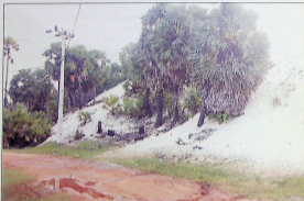
சென்னை நகரத்தைப் பிரித்தெடுத்தில் உயர்ந்த மணற்குன்றுகளில் உச்சிப்பகுதியிலிருந்துள்ள காற்ப்பாணை உட்பகுதியை நோக்கிய கந்திமீன் காட்சி.