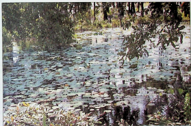
கொழும்புறுணைப் பிரதேசத்தின் காடுகளில் அழகுநீர் திறும் காடுகளில் தாவரங்கள்.

கொழும்புறுணைப் பிரதேசத்தின் தெற்கில் அமைந்து காணப்படும் ஓர் ஊங்கிடப்பட்ட குளம். இது அதிகமாகியான தாவரங்களையும், பசியான மரங்களையும் உள்ளடக்கியுள்ளது.