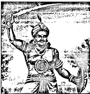
வன்னி வரலாறும் பண்பாடும்

இந்நிலையில் கி.பி. 1796ஆம் ஆண்டு இலங்கையில் பிரித்தானியர் ஆட்சி ஆரம்பமானபோதும் கி.பி. 1802ம் ஆண்டிலே இலங்கை பிரித்தானியரின் முடிக்கிரிய குடியேற்ற நாடாக்கப்பட்டது. இதனைத் தொடர்ந்தே வன்னி இராச்சியம் மீது பிரித்தானிய அரசின் கவனம் திரும்பியது. இக்கால கட்டத்தில் வன்னியை ஆட்சி புரிந்த பண்டார வன்னியன் தொடர்ந்தும் தனித்தியங்க முயன்றபோதெழுந்த முரண்பாட்டினால் பண்டார வன்னியனுக்கும் பிரித்தானியருக்கும் இடையே போர் மூண்டது. இப்பண்டார வன்னியனே வன்னி இராச்சிய மன்னர்களுள் இறுதிப் பெரு மன்னனாக குறிப்பிடப்படுகின்றான்.