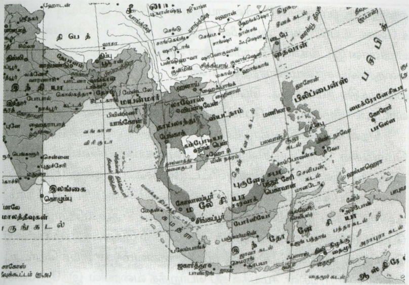
ஆசியாவில் தென்கிழக்காசியாவின் அமைவிடம்

யாவையும், இந்தோனேசியாவையும் இணைத்து மலேசியா என்றும் பர்மாவையும் இந்தியாவுக்குக் கிழக்கில் உள்ள பகுதியையும் அகண்ட இந்தியா, கிழை இந்தியா, பரந்த இந்தியா என்றும் அழைத்தனர்.