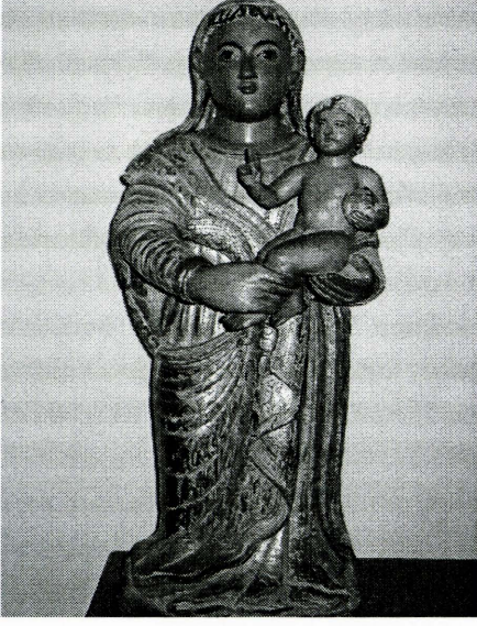
படம். 03: புதுமை மாதா (கோவாவிலுள்ளது)