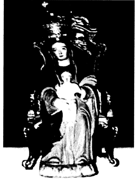
புடம். 06 (இடது): வசாவிளான் உத்தரிய மாதா ஆலயத்திலுள்ள உத்தரிய மாதா, மூலம்: முகப்புத்தகம். புடம். 07 (வலது): சில்லாலை கதிரைச் செல்வி ஆலயத்திலுள்ள கதிரை மாதா, மூலம்: வலைத்தளம்.