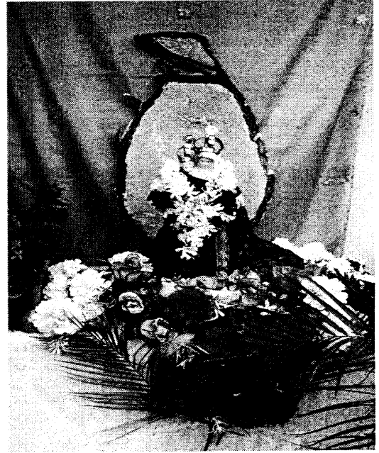
படம். 14: இலங்கை மாதா(சில்லாலை), புகைப்படம்: கிராமவாசி.

பின்னால் இலங்கை போன்ற வடிவம் இருப்பினால் வடிவமைக்கப்பட்டு வைக்கப்பட்டிருந்தது. அண்மையில் இடம்பெற்ற மீள்நிர்மாணப்பணியின்போது அதனை நீக்கிவிட்டனர் ஆனால் வருடாந்த உற்சவ காலத்தில் தற்காலிகமாக ரெஜிபோமினாலான இலங்கை வடிவத்தினை மாதாவின் பின்னால் செய்து வைத்து வருகின்றதோடு தற்பொழுது இலங்கை மாதா என்று அழைத்தும் வருகின்றனர். இவ்வாறே யாழ்ப்பாணத்தின் முதற் சொரூபமாகக் காணப்பட்டதும் இன்று கோவாவில் காணப்படுகின்றதும் “யாழ்ப்பாண மாதா” எனும் சொரூபமும் போர்த்துக்கேயர் காலத்தில் “புதுமை மாதாவே புதிய இராய்ச்சியத்தின் பரிபாலினி” (யாழ்ப்பாணத்தினை ஆளுபவள்) என்று யாழ்ப்பாண இராய்ச்சியத்தின் தாயாகவும், யாழ்ப்பாணத்தை வெற்றி கொண்ட “வெற்றி மாதா”வாகச் (Our Lady of Victory) சிறப்பிக்கப்பட்டுள்ளமை குறிப்பிடத்தக்கது (படம். 1).